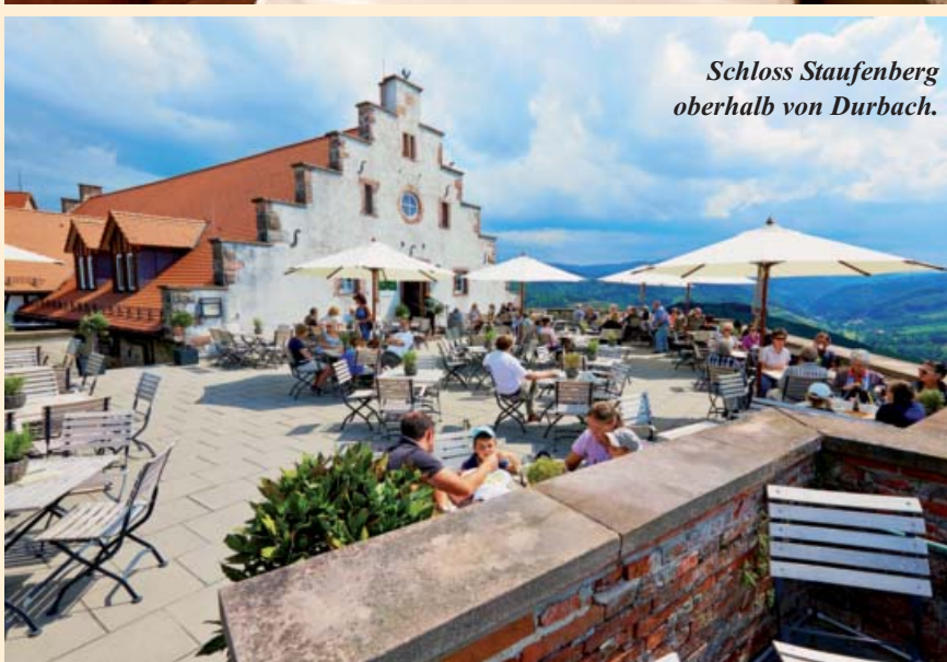
Schloss Staufenberg oberhalb von Durbach.

Doch schließlich soll auch die Gegend erkundet werden – schließlich ist die JAG ein Automobilclub. Der Schwarzwald drängt sich mit seinen vielen kleinen Berg- und Talstraßen geradezu für Fahrten mit klassischen Fahrzeugen an, und so werden auch die beiden Touren am Freitag und Samstag landschaftliche Reize und tolle Ausblicke bieten. Typische Schwarzwaldhöfe mit den tief nach unten gezogenen und mit Holzschindeln gedeckten Dächern, weitläufige Bergwiesen, dichte Waldstücke – hier versteht man recht schnell, woher der Schwarzwald seinen Namen hat – und Panoramablicke ins Rheintal liegen an der Strecke.