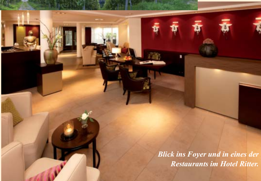
Blick ins Foyer und in eines der Restaurants im Hotel Ritter.