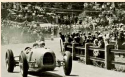
Hans Stuck siegte vor 80 Jahren am Freiburger Schauinsland.

dieser Strecke vor achtzig Jahren, 1934, mit dem damals ganz neuen Auto-Union-Sechszehnzylinder, den Ferdinand Porsche entwickelt hatte. Und wenig später hatte Stuck den Namen „Bergmeister“ weg.